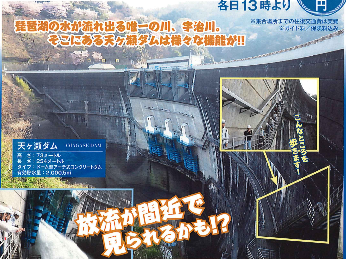
天ヶ瀬ダム AMAGASE DAM

高さ:73メートル 長さ:254メートル タイプ:ドーム型アーチ式コンクリートダム 有効貯水量:2,000万m