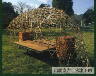
出展協力：木津川市

京都南部のお茶エリアで製作された流派や形式にとられないコンセプト茶室が「お茶ふえす」に登場。