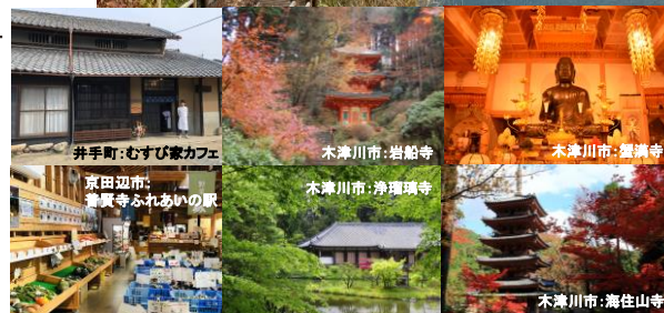
井手町:むすび家カフェ