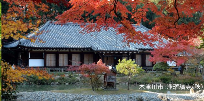
木津川市:浄瑠璃寺(秋)