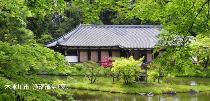
木津川市:浄瑠璃寺(夏)