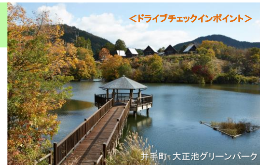
井手町:大正池グリーンパーク