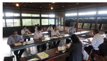
↓キックオフミーティング風景

お茶の京都ってどこキャンペーン (クイズ・中吊り広告・SNS広報など) 7月13日～7月31日