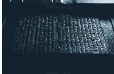
▲「鉄眼版一切経版木」(重要文化財)