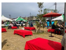
「茶づな」初の屋外エントランスでのイベント!!