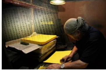
▲明朝体のルーツを映像で表現