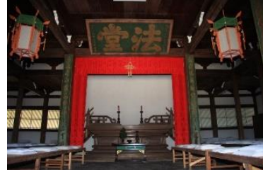
▲非公開の萬福寺法堂を特別会場に