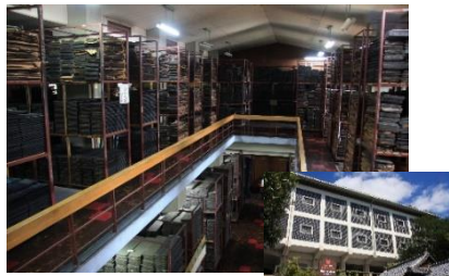
▲宝蔵院収蔵庫見学ツアー