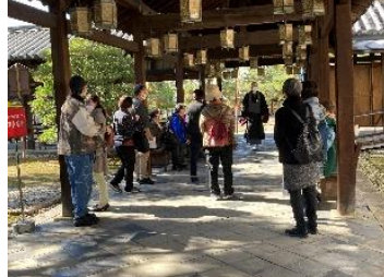
▲萬福寺伽藍見学ツアー