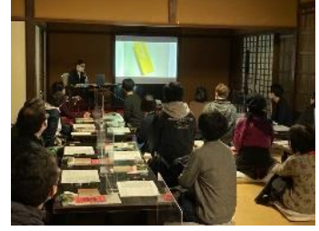
▲レタリングワークショップ