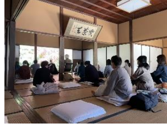
▲まるごと体験プラン:座禅体験