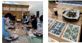
宗円交遊庵やんたんでもみ体験を行いました！

宇治田原町内のフィールドワークや、やんたん里づくりの会・地域おこし協力隊の皆様との意見交換を通して地域理解を深めていただきました！