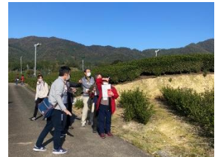
安積親王陵墓周辺