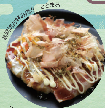
高岡流お好み焼き ととまる