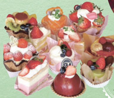
地元 精華町の 絶品 スイーツも!