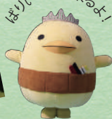
ばりいさんも来るよ!