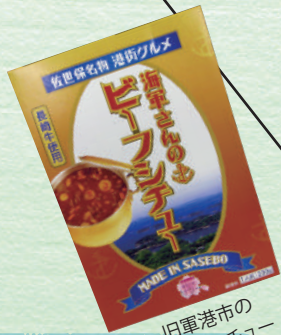
旧軍港市の ビーフンチャー