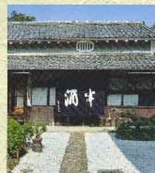
宇口宿・文徳寺跡 京口宿