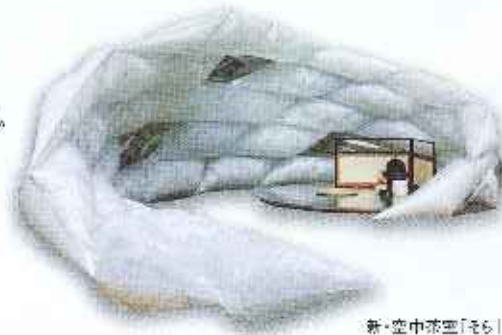
新・空中茶室「そら」