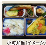
小町弁当(イメージ)