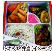
ふれあい弁当(イメージ)