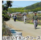
山吹ハイキングコース

JA宇治茶の郷(宇治田原町)＝JR山城多賀駅西口＝近鉄新田辺駅＝京田辺市立中部住民センター… 9:00 9:40 10:10 10:30 …山城大橋…〇JAなごやか市(京野菜など買い物)…〇田原道…〇白坂テクノパーク＝上井手公民館駐車場… …玉津岡神社・地蔵院…〇井手町まちづくりセンター椿坂(昼食・伊賀越えミニ座談会)…宮本水車… 12:00 14:30 …玉川山吹ハイキングコース＝JR山城多賀駅西口＝近鉄新田辺駅＝JA宇治茶の郷(宇治田原町) 15:30 16:00 16:30