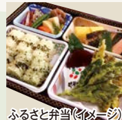
ふるさと弁当(イメージ)