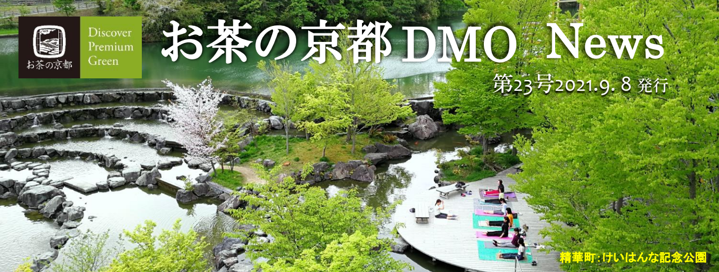
精華町: けいはんな記念公園