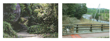
笠置山登山道 (C-6) 鹿鷹橋 (F-9)

布目川の甌穴群 (G-5) 甌穴は河底のくぼみに、うずまき流が生じ中に落ち込んだ小石が回転しながら河床を深く削ることができる珍しい穴です。