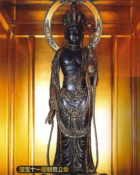
国宝十一面観音立像