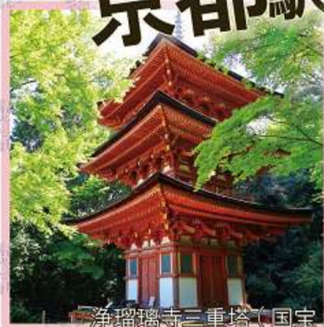
浄瑠璃寺三重塔(国宝)

浄瑠璃寺の国宝九体阿弥陀如来坐像は、およそ110年ぶりに大規模な修理が行われました。5カ年に及ぶ修理が完成し、九体が揃った状態となることを記念して、ツアーを実施します。浄瑠璃寺など南山城の古寺3ヶ寺をバスで巡るコースと、足を延ばして4ヶ寺をジャンボタクシーで巡るコースがあります。どちらのコースも、国宝や重要文化財に指定されている仏像など、貴重な文化財と出会うことができます。