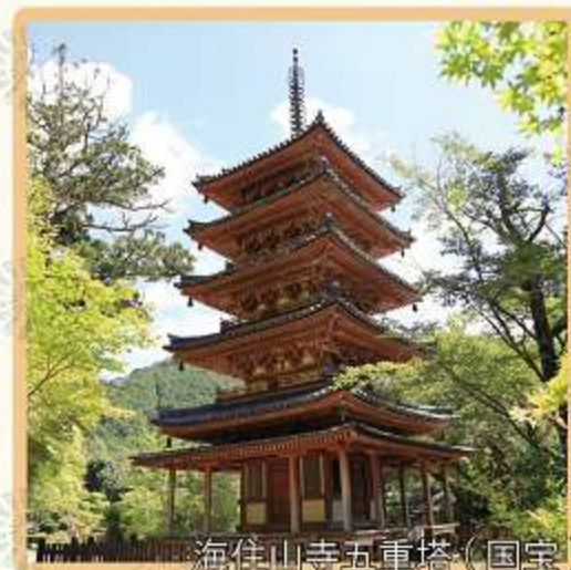
海住山寺五重塔(国宝)

国宝の十一面観音立像は全国に7体、そのうちのひとつが大御堂観音寺で拝観いただけます。寿宝寺では、実際に千本の手を持つ十一面千手千眼観音立像(重要文化財)を、海住山寺にて十一面観音立像(重要文化財)を拝んでいただき、巨石信仰の地 笠置寺(笠置山は国指定史跡・名勝)を巡ります。昼食は、御料理 大扇にて、老舗料亭の味と彩りをお楽しみください。