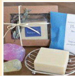
手づくり石けんの店ツクツク