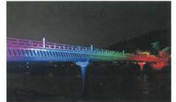
朝霧橋ライトアップ