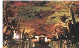
琴坂ライトアップ