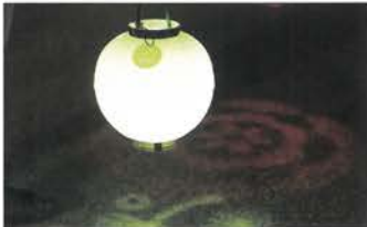
NAKEDディスタンス提灯®