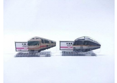
▲KTR8500形、タンゴ・エクスプローラー アクリルスタンド 各1,000円(税込)