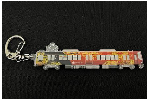
▲アクリルキーホルダー 770円(税込)