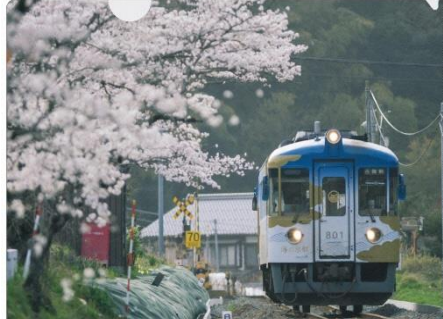
▲海の京都トレイン クリアファイル 400円(税込) ※200枚限定