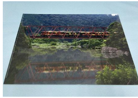
▲(水鏡)クリアファイル 550円(税込)