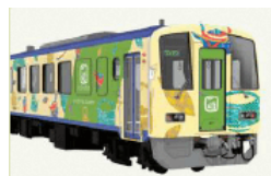
▲「お茶の京都トレイン」 (キハ120形)