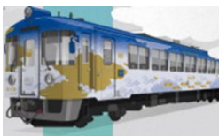
▲「海の京都トレイン」 (KTR801)