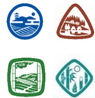
▲スタンプイメージ