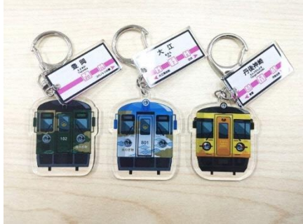
▲駅名看板付きアクリルキーホルダー (全13種+シークレット1種) 500円(税込) ※カプセルトイにて販売