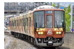
▲「森の京都 QR トレイン」 (223系)