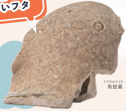
とりちゆうふた 鳥鈕蓋