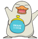
スマートイコカのイコちゃん