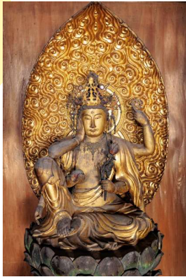
秘仏・如意輪観音菩薩像