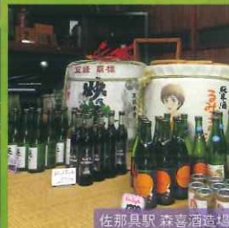
佐那具駅 森喜酒造場