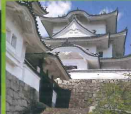
伊賀上野駅 伊賀上野城