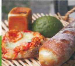
大河原駅 ミッシーのパン