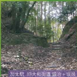
加太駅 旧大和街道 鍛冶ヶ坂峠