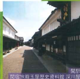
関駅 関宿旅籠玉屋歴史資料館 深川屋