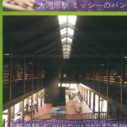
新堂駅 SHINDO YARDS 図書館 BOOKMARK STORAGE