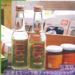
笠置駅 笠置まちづくり林チャレンジショップ